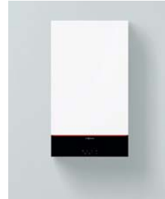
Vitodens 100-W (B1HF und B1KF)

Das Kombigerät Vitodens 100-W beinhaltet einen integrierten Durchlauferhitzer zur Warmwasserbereitung.