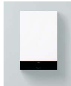
Vitodens 111-W (B1LF)

Abweichende Nenn-Wärmeleistung bei Betrieb mit Flüssiggas oder die Verwendung in Mehrfachbelegung, siehe Planungsanleitung